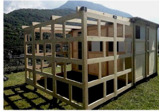
PROSPETTO LATERALE SINISTRO