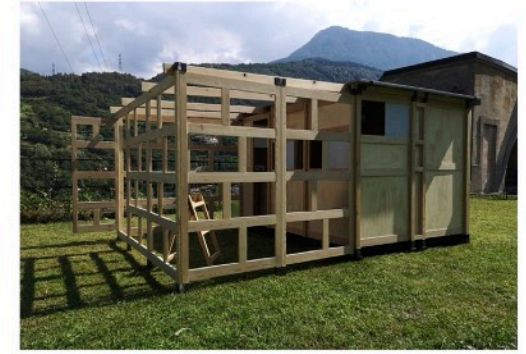
PROSPETTO LATERALE DESTRO