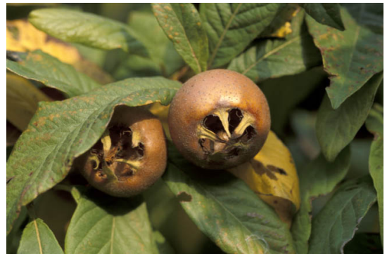
NESPOLO GERMANICO "Col tempo e con la paglia maturano le nespole" VENGONO RACCOLTE A FINE AUTUNNO E SONO MANGIABILI A GENNAIO/ FEBBRAIO