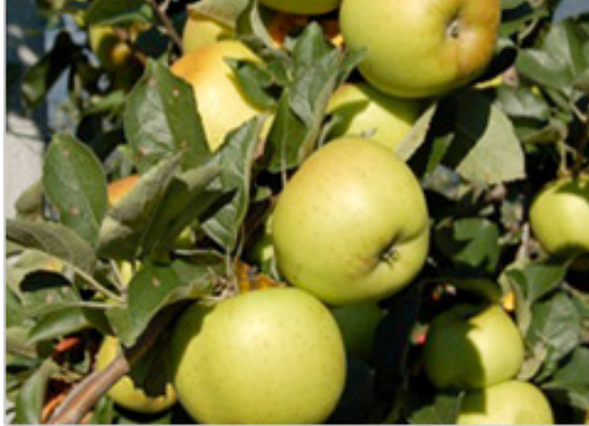
MELO GIACINTO : MELA VERDE/GIALLA, SIMILE ALLA RENETTA, MATURAZIONE A SET- TEMBRE.