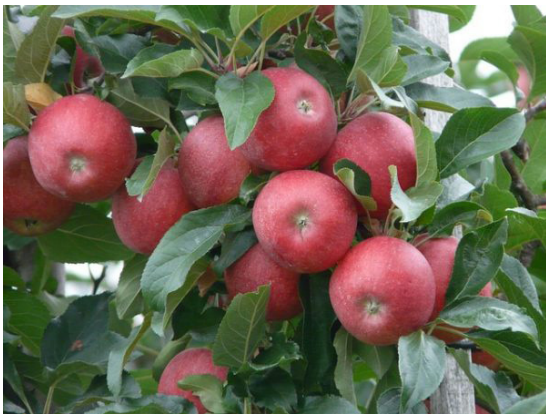
MELO SCHILPARIO: MELA ROSSA DI MONTA- GNA (FINO A 1000M DI QUOTA), MATURAZIONE SETTEMBRE.