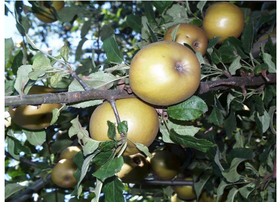
MELO DOTUR: MELA MARRONE, MATU- RAZIONE AD OTTOBRE.